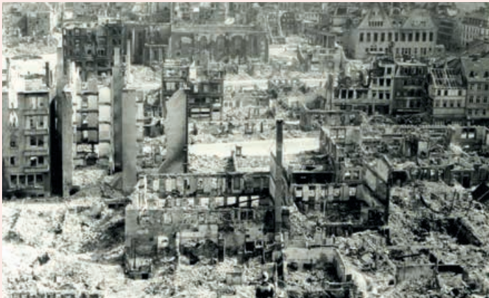
Rathaus; Leonhardsviertel, 22 August 1944