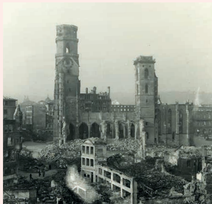
Stiftskirche 1944, E. Müller Wikimedia commons, unverändert, https://de.m.wikipedia.org/wiki/Datei:Stuttgart_destruction_-_codingdavinci_-_9200_F_45857.jpg