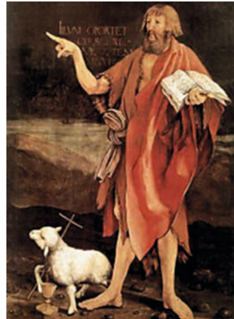
Bild: Matthias Grünewald, Isenheimer Altar