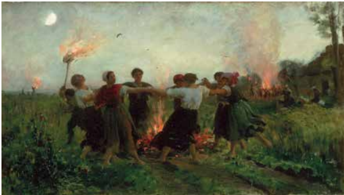
Johannisfest, Gemälde von Jules Breton 1875