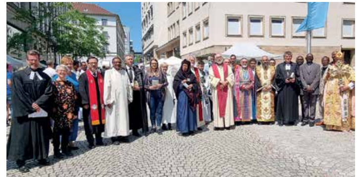
Gottesdienst mit Bildeinverständnis