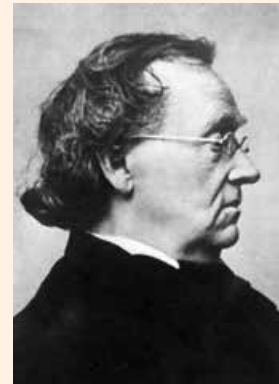
Eduard Mörike

Der Autor des »Stuttgarter Hutzelmännleins« gilt als schrulliger Biedermann und arbeitsscheuer Pfarrer mit unstemtem Lebenslauf quer durch das Schwabenland und Hohenlohe. Aber mit seinem »Orplid« schuf er eine interessante Utopie als Gegenwelt zur beginnenden industriellen Moderne. In religiösen Fragen empfahl er einen »mittleren Weg« zwischen radikaler Aufklärung und Pietismus. Das klingt vernünftig und fast schon ein wenig buddhistisch.