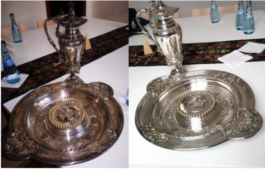
Taufkelch und Taufschale der Hospitalgemeinde aus dem Jahr 1804.