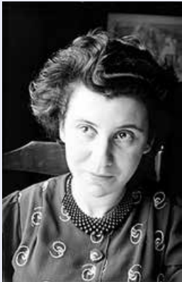
Etty Hillesum, 1939