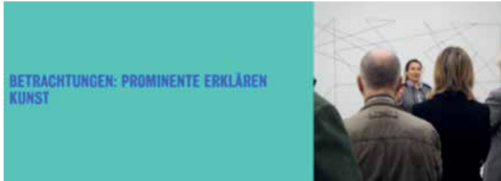
Bild: Ausstellungsansicht, © Kunstmuseum Stuttgart, Claudia Magdalena Merk, Ausstellungsansicht »Frischzelle_27«