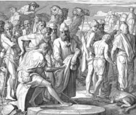
Julius Schnorr von Carolsfeld

Mittwoch, 11. April 2018, 18:00-19:30 Uhr, Hospitalhof Geschwistergeschichten – Joseph und seine Brüder