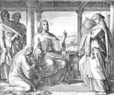
Julius Schnorr von Carolsfeld

Mittwoch, 16. Mai 2018, 18:00-19:30 Uhr, Hospitalhof Geschwistergeschichten – Marta und Maria