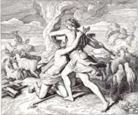
Julius Schnorr von Carolsfeld

Mittwoch, 14. März 2018, 18:00-19:30 Uhr, Hospitalhof Geschwistergeschichten – Kain und Abel