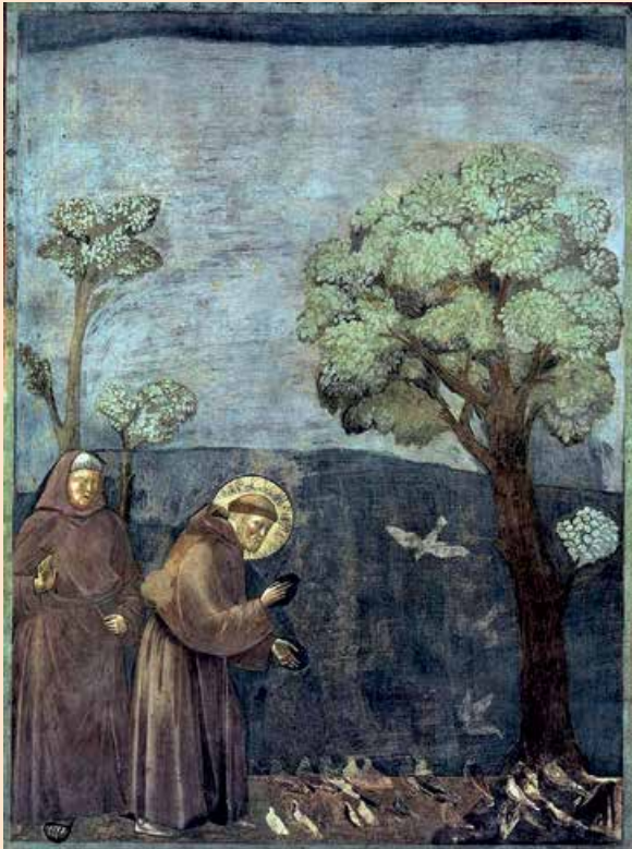
Franziskus' Vogelpredigt auf einem Fresko von Giotto di Bondone (um 1295)

KOOPERATION: Staatsoper Stuttgart, Kath. Bildungswerk Stuttgart, Kath. Stadtdekanat Stuttgart, Station S, Ev. Kirche in der City, Evang. Bildungszentrum Hospitalhof Stuttgart. KOSTENBEITRAG entfällt.