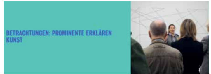
Bild: Ausstellungsansicht, © Kunstmuseum Stuttgart, Claudia Magdalena Merk, Ausstellungsansicht »Frischzelle_27«