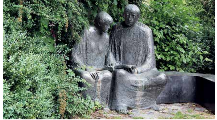
Skulptur von Meister Eckhart in Bad Wörishofen