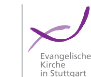
Evangelische Kirche in Stuttgart