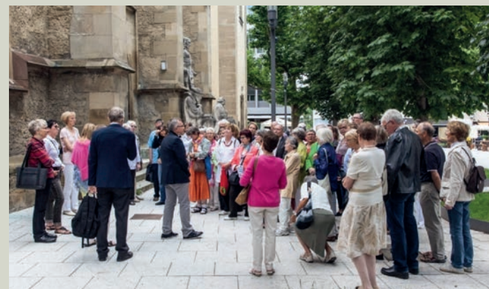
Quartiersführung.