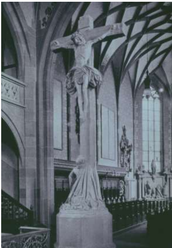
Seyfer-Kreuz in der Hospitalkirche Stuttgart, 1905

Lange wurde überlegt, wie die Figuren in der Kirche Platz finden könnten. Schließlich wurde die Gruppe 1905 getrennt und nur das Kreuz mit Christus und der den Kreuzstamm umfassenden Maria Magdalena im Mittelschiff der Hospitalkirche aufgestellt, die Figuren der Maria und des Johannes verblieben im Vorraum.